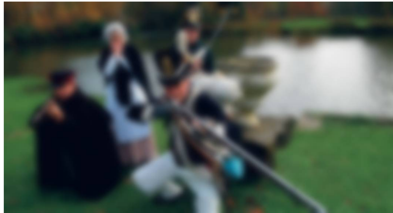
De vzw hoopt rond de honderd Mallenaren aan te trekken die zowel acteren als figureren in het schouwspel. De re-enactors nemen de uitbeelding van de veldslagen voor hun rekening.